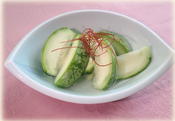
メロンの白醤油漬け