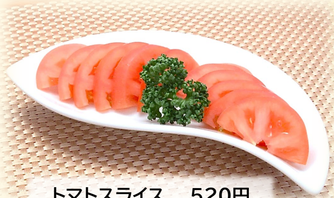
トマトスライス 520円