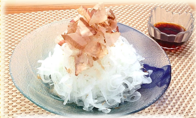
オニオンスライス 500円